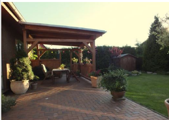
Überdachung auf der Terrasse

Zimmer: 4,00 Wohnfläche ca.: 150,00 m 2 Kaufpreis: 205.000,00 EUR