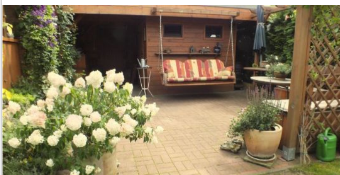
Sitzecke im Garten