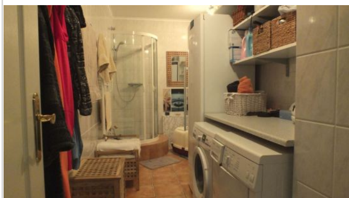
HWR mit Dusche